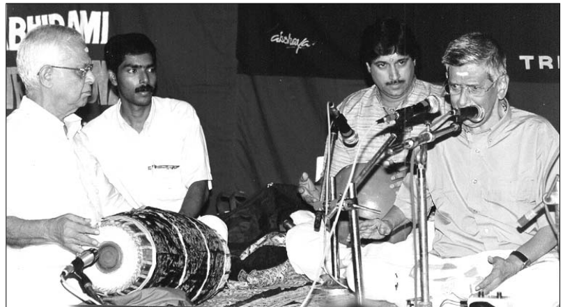
മാവേലിക്കരയുടെ പ്രഭാകരവർമ്മയുടെ സംഗീതക്കച്ചേരിയുടെ മറ്റൊരു ദൃശ്യം

ദിവസം കഴിഞ്ഞെത്തിയപ്പോൾ വല്യച്ഛൻ കുറെ ശകാരിച്ചു. കൊച്ചുട്ടമ്മാൻ പോയി... കാലചക്രം തിരിഞ്ഞു കൊണ്ടേ ഇരിക്കുന്നു. ആ വായ്മൊഴി വഴക്കങ്ങളും നിർദ്ദോഷമായ ഫലിതങ്ങളും കളങ്കലേശമില്ലാത്ത മനസ്സും ഉറക്കെ ചിരിക്കുന്ന പ്രകൃതവും ഒട്ടനവധി വേദനിപ്പിക്കുന്ന ഓർമ്മകൾ ഇന്നും തെളിഞ്ഞു തന്നെ നിൽക്കുന്നു. കൊച്ചുട്ടമ്മാൻ മറ്റേതോ ലോകത്തിരുന്ന് ഇപ്പോഴും പൊട്ടിച്ചിരിക്കുന്നുണ്ടാവാം. ●