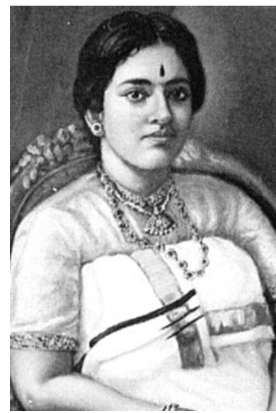
റീജന്റ് മഹാരാണി സേതുലക്ഷ്മിബായിയുടെ നൂറ്റിപ്പതിമൂന്നാം ജന്മത്തിനവസരം 23ന് തിരു