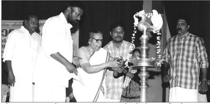
തിരുവനന്തപുരം ക്ഷത്രിയക്ഷേമസഭയുടെ ഓണാഘോഷപരിപാടികൾ പരപ്പനാട് വലിയ തമ്പുരാട്ടി അമ്പലത്തിൽ കൊട്ടാരത്തിൽ പുരാനാൾ അംബാലിക തമ്പുരാട്ടി ഉദ്ഘാടനം ചെയ്യുന്നു